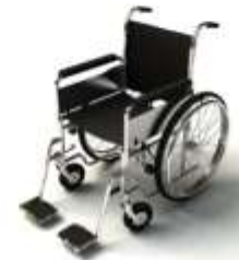
การรับรถเข็นเป็นพิเศษ

กรณีผู้เดินทางต้องการความช่วยเหลือเป็นพิเศษ อาทิเช่น การใช้วีลแชร์ กรุณาแจ้งบริษัทฯ อย่างน้อย 7 วันก่อนการเดินทาง มิฉะนั้นบริษัทฯ จะไม่สามารถจัดการล่วงหน้าได้ เนื่องจากการขอใช้วีลแชร์ในสนามบินนั้น ต้องมีขั้นตอนในการขอล่วงหน้า และบางสายการบินอาจมีการเรียกเก็บค่าใช้จ่ายทั้งทางสนามบินไทยและในต่างประเทศ ซึ่งผู้เดินทางสามารถสอบถามกับเจ้าหน้าที่ได้โดยตรงก่อนทำการจอง และหากในขณะของท่านมีผู้ต้องการดูแลพิเศษ เช่น ผู้ที่นั่งรถเข็น (Wheelchair), เด็ก, ผู้สูงอายุและผู้ที่มีโรคประจำตัวหรือไม่สะดวกในการเดินทางท่องเที่ยวในระยะเวลาเกินกว่า 4 - 5 ชั่วโมงติดต่อกัน ท่านและครอบครัวต้องให้การดูแลสมาชิกภายในครอบครัวของท่านเอง เนื่องจากการเดินทางเป็นหมู่คณะ หัวหน้าทัวร์มีความจำเป็นต้องดูแลคณะทัวร์ทั้งหมด