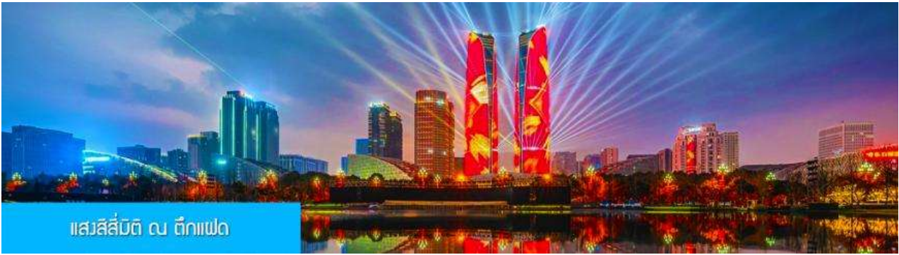
แสงสีส้มติ้ ฅ ตึกแฝด

หลังอาหารนำท่านชมแสงสีส้มติ้ ฅ ตึกแฝด 双子塔赏灯光夜景 ไอคอนที่โดดเด่นใจกลางเมืองเฉิงตู..... พักที่ โรงแรม FAIRFIELD BY MARRIOTT CTU HITECH ZONE HOTEL ระดับ 4 ดาวท้องถิ่นหรือเทียบเท่าในเมืองตูเจียง