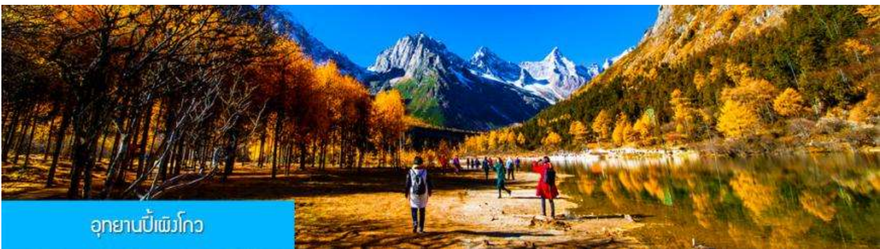
อุทยานปีเพิงโกว