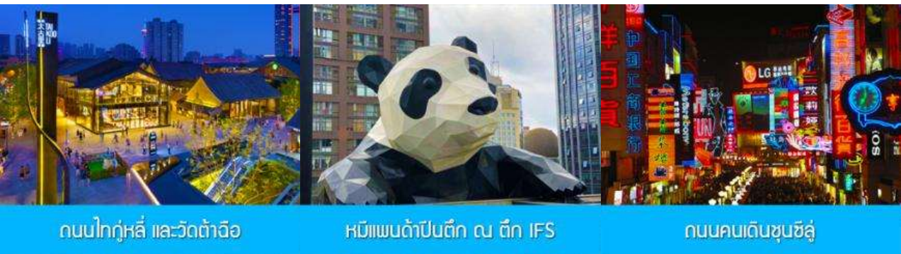
ถนนไท่กู่หลี่ และวัดต้าเจี๊ว

หลังอาหารนำท่านชมแสงสีส้มติ้ ฅ ตึกแฝด 双子塔赏灯光夜景 ไอคอนที่โดดเด่นใจกลางเมืองเฉิงตู..... พักที่ โรงแรม FAIRFIELD BY MARRIOTT CTU HITECH ZONE HOTEL ระดับ 4 ดาวท้องถิ่นหรือเทียบเท่าในเมืองตูเจียง