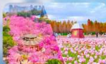
เทศกาลดอกซากุระบานภูเขาหยวนกง & ทุ่งดอกทิวลิป