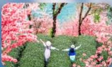
หุบเขาซากุระอุ๋นลี่ยงซาน