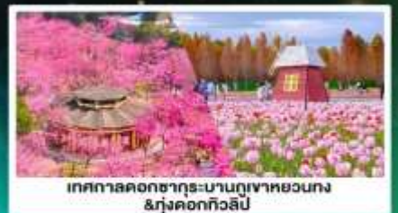
เทศกาลดอกซากุระบานกุเวาหยวนกง &ทุ่งดอกทิวลิป