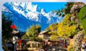
เมืองโบราณลี้เจียง