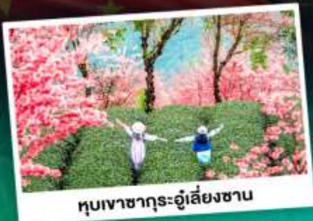
หุบเขาซากุระอุ๋เหลียงซาน