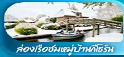
ล่องเรือชมหมู่บ้านทึร์น

พิเศษ ล่องเรือแม่น้ำเซน ชมเมือง โดย ชาโต มูช