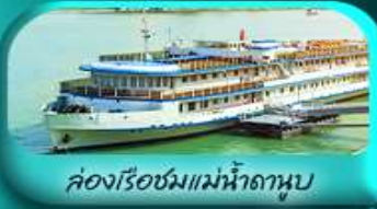
ล่องเรือชมแม่น้ำดานูบ