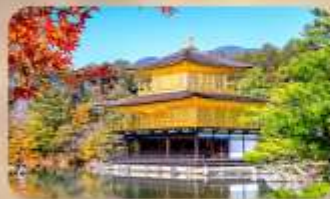
วัดทองคินคะคุจิ