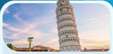
หอเอนปิซา

23 ม.ค. - 01 ก.พ. 69 / 10-19 ก.พ. 69 06-15 มี.ค. 69 / 12-21 มี.ค. 69 26 มี.ค. - 04 เม.ย. 69