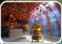
วัดหมื่นโหมง