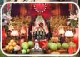
วัดเจ้าแม่กวนอิมองค์ใหม่