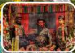
วัดกวนไท (เทพเจ้ากวนอู)