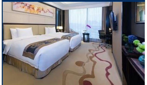
พักที่ DADING CENTURY HOTEL หรือเทียบเท่า 5 ดาว

รายการและเที่ยวบินอาจมีการเปลี่ยนแปลงตามความเหมาะสม