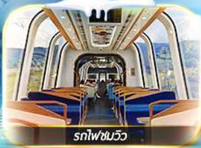
รถไฟชมวิวด