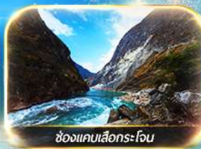
ช่องแคบเสื่อกระโถน