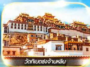
วัดทิเบตชางจันหลิน