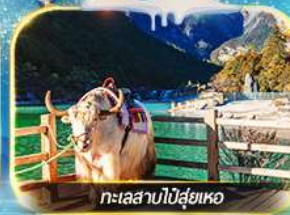
ทะเลสาบป๋ายู่เหอ