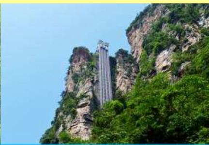
ลิฟท์แก้วไปหลง