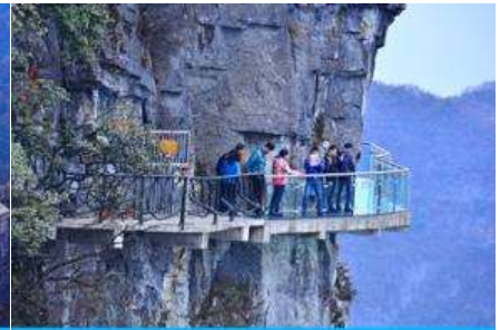
หน้าผาลอยฟ้าทางเดินกระจก