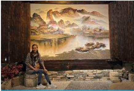
พิพิธภัณฑ์ภาพเขียนหินทราย

พักที่ ZHENMIAN HOTEL OR YINXIANG HOTEL ระดับ 4 ดาวท้องถิ่นหรือเทียบเท่าในเมืองจางเจียเจีย