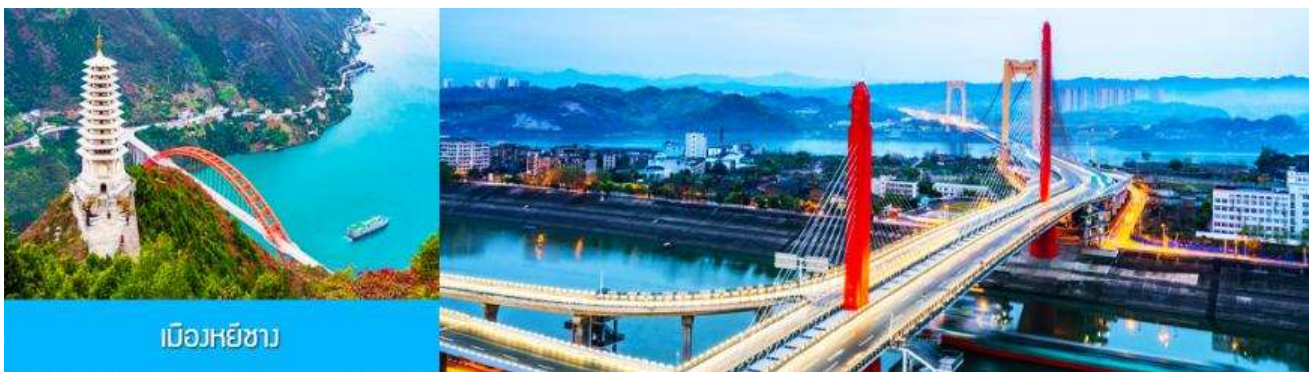
เมืองหยีชาง

ชมลัพท์แก้วไปหลง 2. โชว์จิ้งจอกขาว โปรอ่านรายละเอียดในโปรแกรม