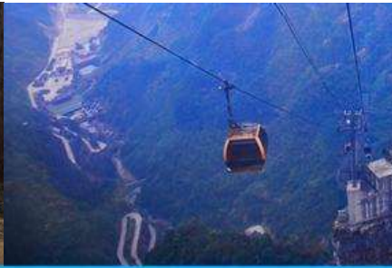
กระเช้าขึ้นเขายเทียนเหมินซาน