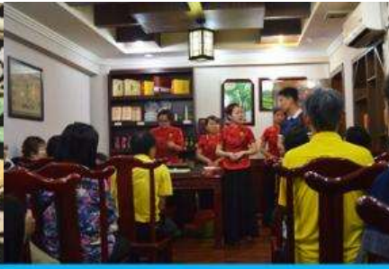
ร้านใบชา