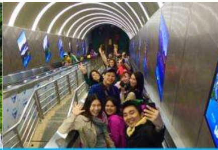
บันไดเลื่อนทะลุภูเขา