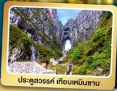
ประตูสวรรค์ เทียนเหมินซาน