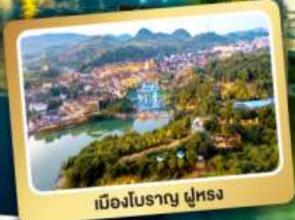
เมืองโบราณ ฟูหลง