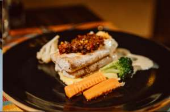
เสิร์ฟอาหารแบบ Fine Dining 3-4 Course